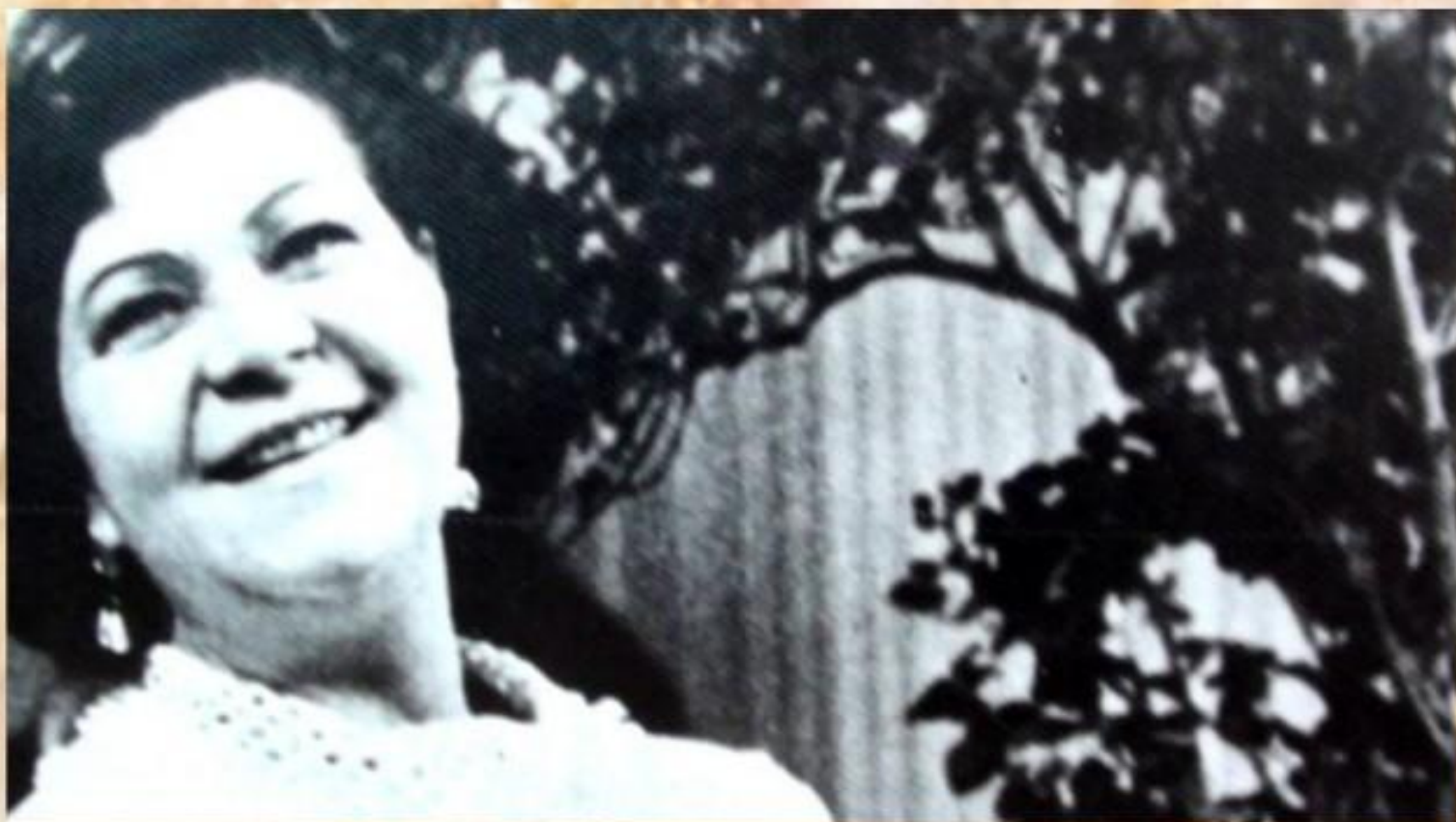
К.И.Шульженко во время съёмок на Центральном телевидении. 1960-е годы

Я просто не могу петь под собственный голос и в таком случаи превращаюсь в слушателя. Творчество всегда неповторимо.